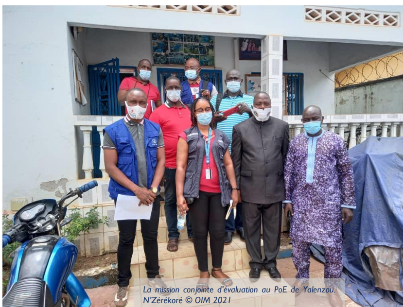
La mission conjointe d'évaluation au PoE de Yalenzou. N'Zérékoré

Merci de visualiser les supports ci-dessous :