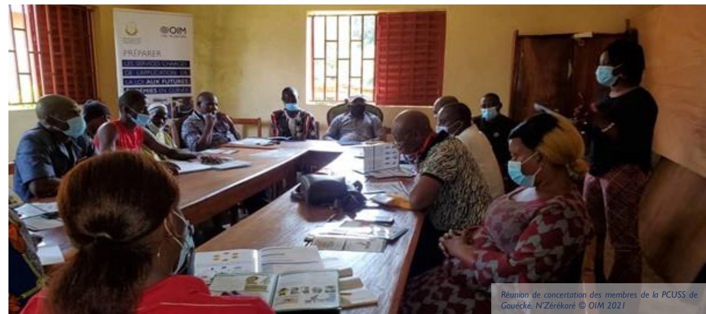
Réunion de concertation des membres de la PCUSS de Gouécké, N'Zérékoré

La réactivation et l'encadrement de la PCUSS de Gouécké ont été rendus possibles grâce à l'appui de l'OIM.