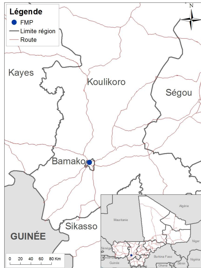
Cette carte est à titre indicatif seulement. Les représentations et l'utilisation des frontières et des noms géographiques sur cette carte peuvent contenir des erreurs et n'impliquent aucun jugement sur le statut juridique d'un territoire, ni reconnaissance ou acceptation officielle de ces frontières par l'OIM.

L'OIM Mali a pris contacte avec l'ambassade ainsi que le bureau de l'OIM Niger pour mettre en place des dispositions d'assistance rapide à ces migrants.