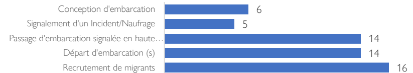
Fig.1- Types d'alertes lancées (1—30 septembre 2020)

Entre le 1 er et le 30 septembre 2020 , 61 alertes ont été signalées. Certaines alertes font état de départs d'embarcations ( 14 ) depuis les côtes du Sénégal (au Nord de St-Louis, à Gandiol, à Mbour, à Joal), et à Barra (en Gambie), d'autre de recrutement en cours de migrants ( 16 listes ouvertes à l'heure actuelle avec 1 475 inscrits ) en vue d'un départ prochain.