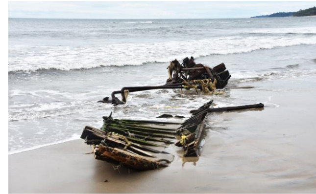
L'épave du navire dans lequel voyageaient les migrants